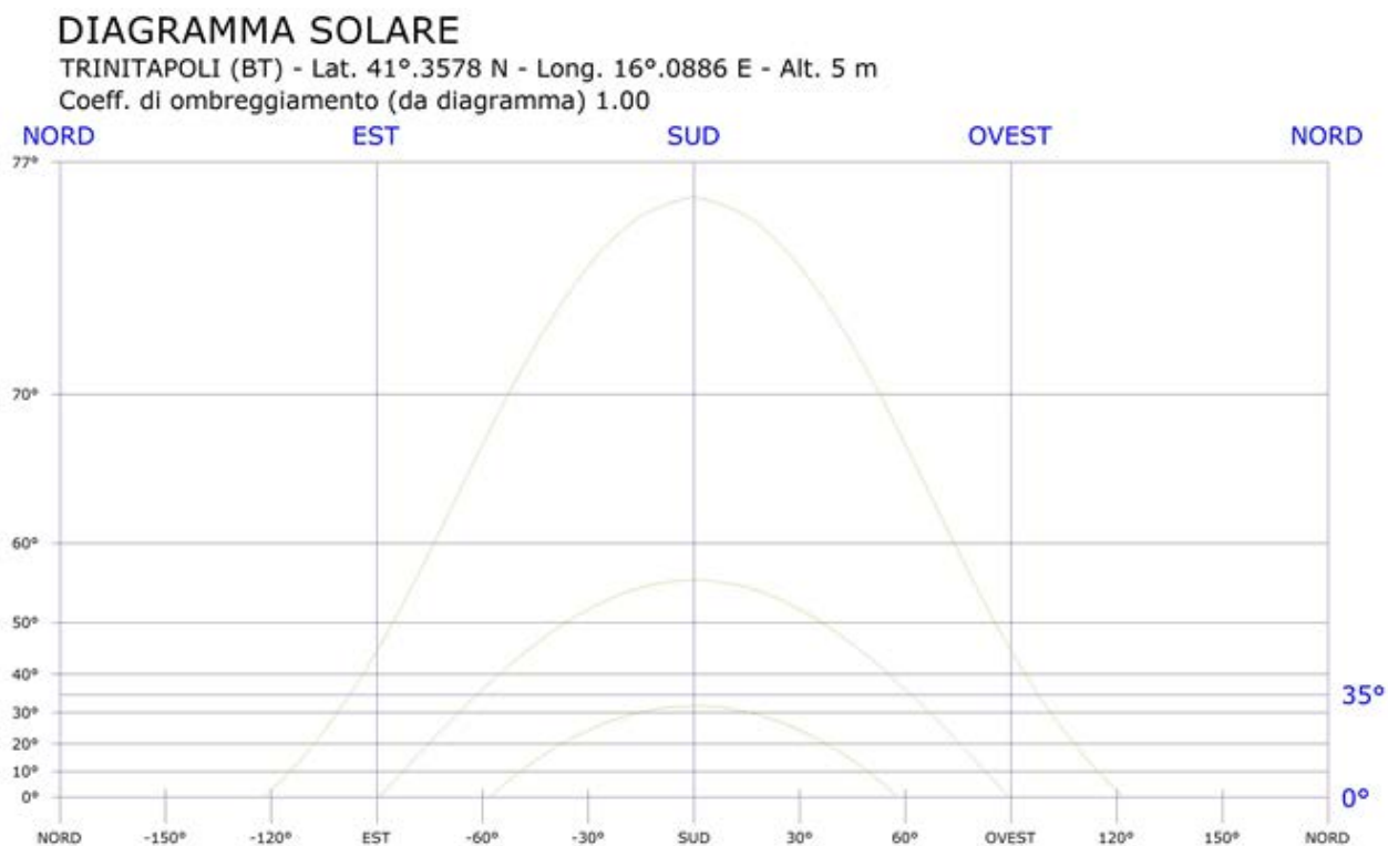
Figura 2- Diagramma solare

Di seguito il diagramma solare per il comune di TRINITAPOLI: